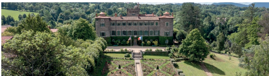
Château de Chavaniac-Lafayette