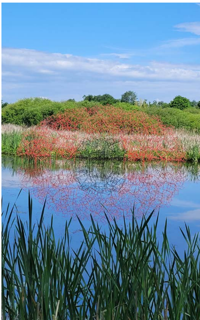
Simulation de l'œuvre

L'idée ici est de modifier l'espace en y apportant l'inutile, de modifier la perspective pour esquisser l'idée que c'est peut être différent... et de provoquer une réflexion intime sur notre attitude face à la Nature.