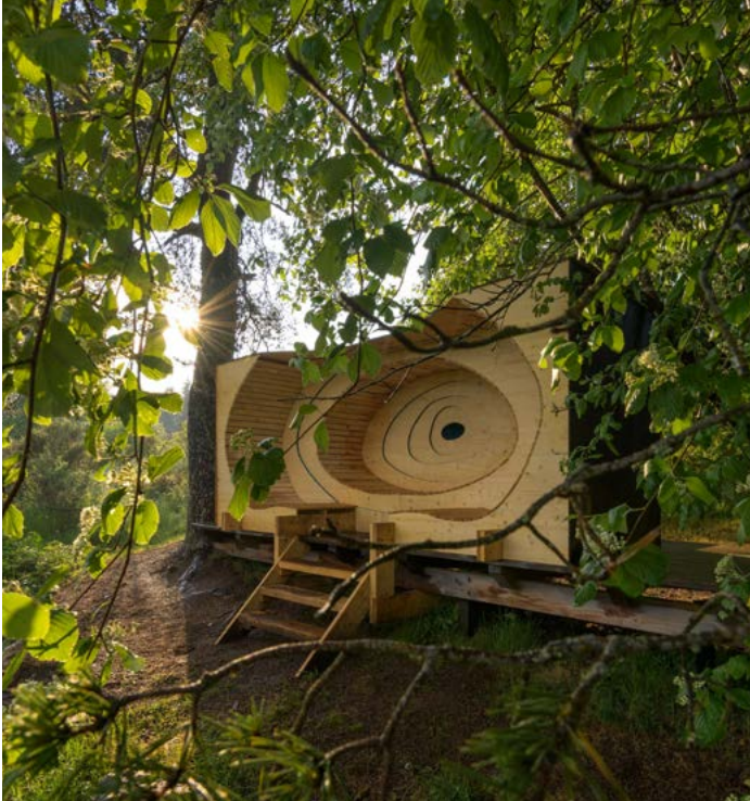
Simulation de l'œuvre