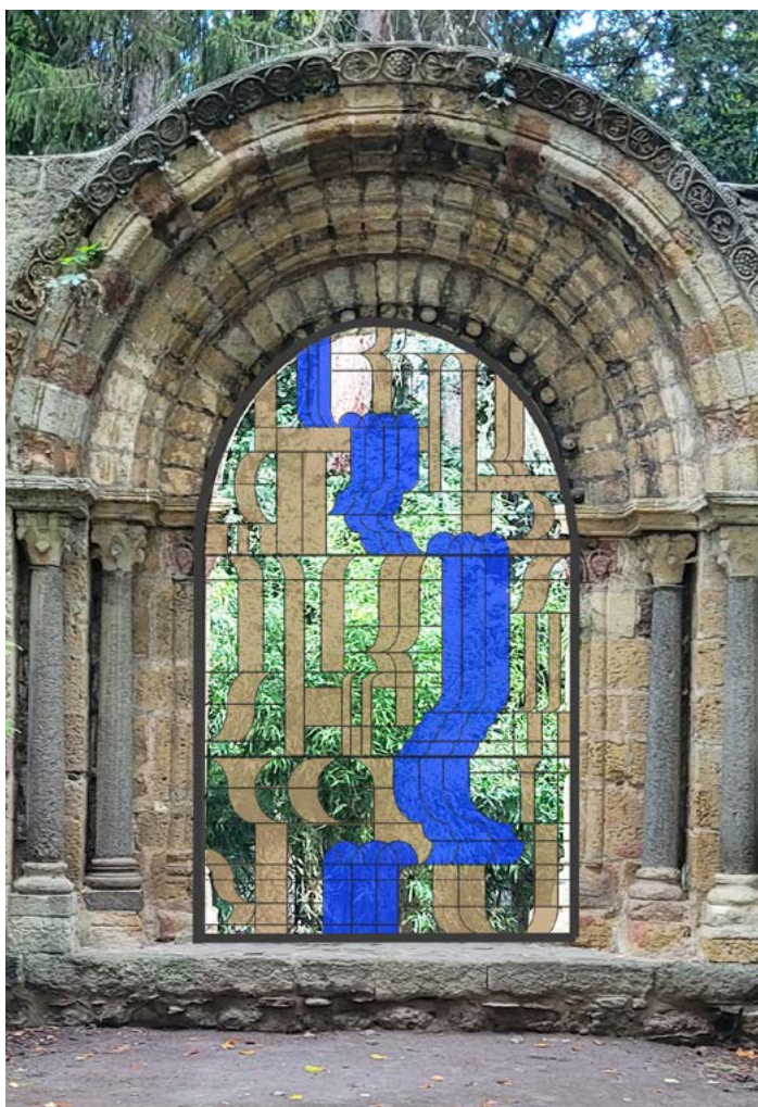
Simulation de l'œuvre

PHAOS est un vitrail placé dans l'ouverture de la porte romane installée dans le jardin Henri-Vinay. Le vitrail est un objet qui entre en relation avec son environnement de part la lumière qu'il reçoit et celle qu'il renvoie. La pratique de Pia Hinz remet au goût du jour la technique du vitrail dans un contexte original. PHAOS joue avec les constructions de la porte romane et y ajoute même un élément architectural. Le motif fait référence aux fontaines du parc qui aspirent à souligner la relation entre œuvre, architecture et paysage.