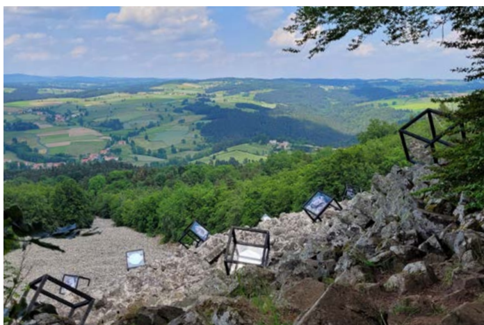
Simulation de l'œuvre