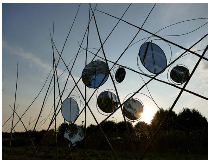
Simulation de l'œuvre