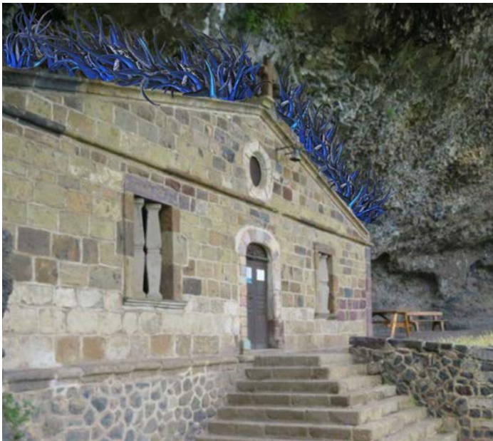
Simulation de l'œuvre